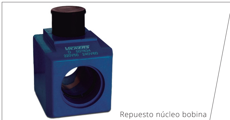
Repuesto núcleo bobina